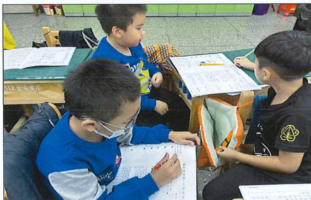
照片簡述：學生上課情形